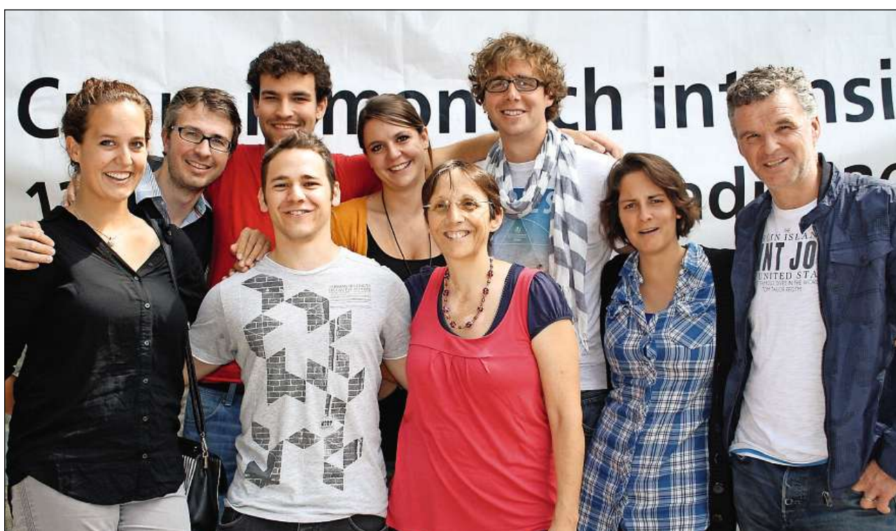
Semtgai pils participonts: Scolastas e scolasts dil Cuors romontsch sursilvan.