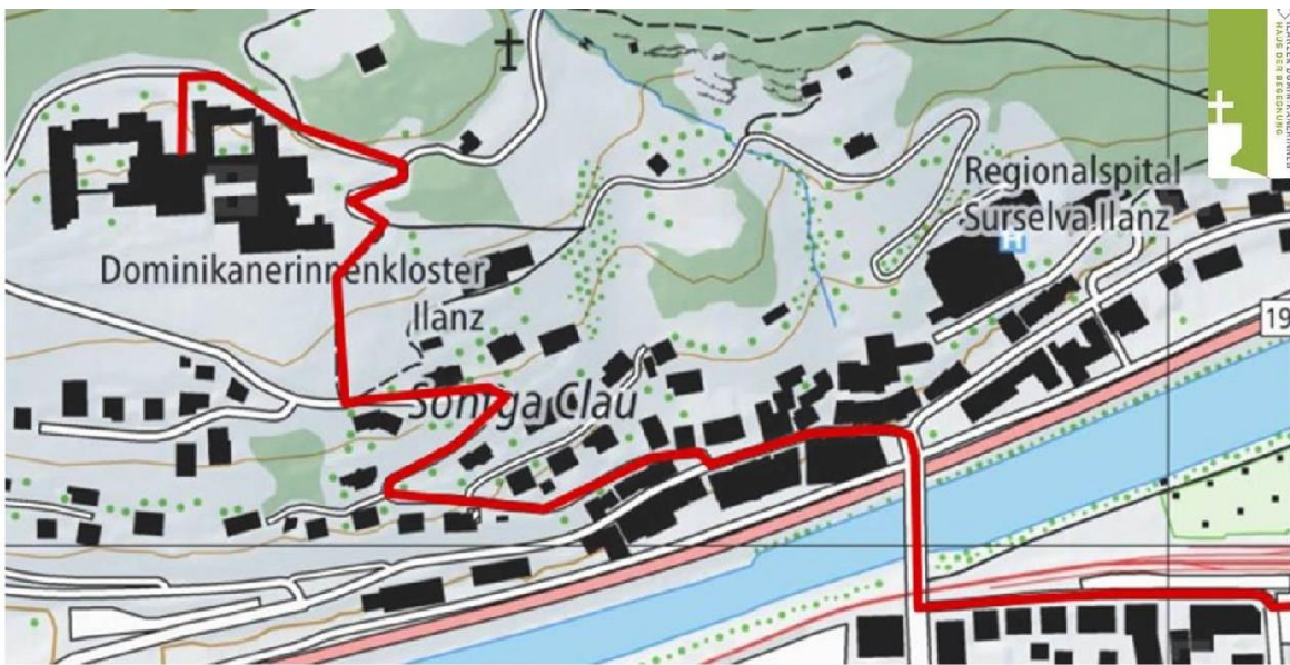
Oben: Fussweg vom Bahnhof zum Haus der Begegnung